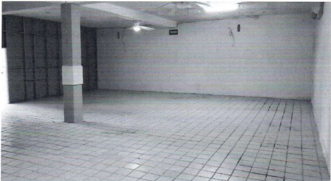
Área para recuento de votos Vista Poniente-Oriente