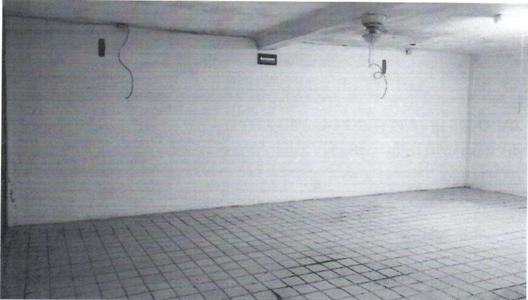
Área para recuento de votos Vista Oriente-Poniente